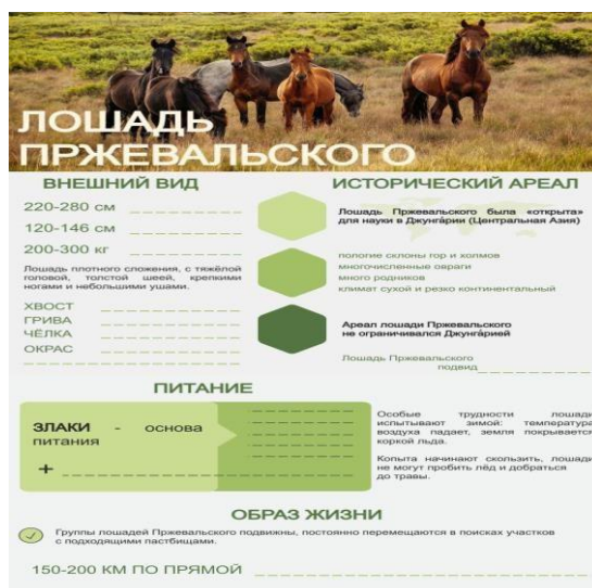
Рисунок 5. Шаблон инфографики

Питание. «Основу питания диких азиатских лошадей в Джунгарии составляли злаки: ковыли, житняк, овсяница, чий, тростник. Поедали они и полыни, и дикий лук, и мягкие части различных полукустарников. <...> Особые трудности лошади испытывают зимой, когда после дождя или сильной оттепели температура воздуха резко падает, и земля покрывается коркой льда (джут). Копыта начинают скользить, лошади не могут пробить лёд и добраться до травы, начинается голод» [9].