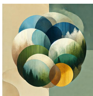
Рисунок 1. Фоносемантическая оценка стихотворения А.А. Блока “Сольвейг” (ИИ)

Как можно заметить, ИИ также выделяет следующие главные цвета стихотворения: зеленый, синий, кремовый/желтый. Цветовой круг, созданный ИИ, отражает баланс между зимним спокойствием (серые и белые круги), весенним пробуждением (зелёные и голубые оттенки) и радостью, принесенной Сольвейг (золотисто-желтые тона). Такой подход гармонично соединяет основные образы стихотворения.