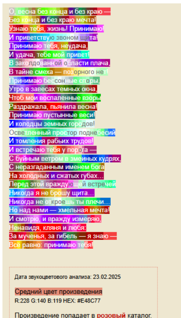
Рисунок 4. Фоносемантическая оценка стихотворения А.А. Блока «О весна без конца и без краю...» (Звукоцвет.ру)

Сходные результаты показала и программа «Звукоцвет.ру».