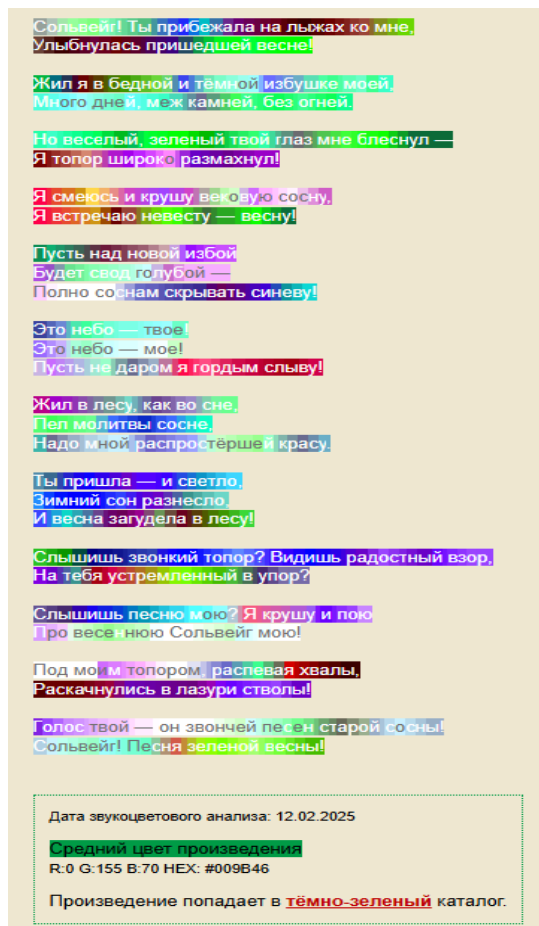
Рисунок 2. Фоносемантическая оценка стихотворения А.А. Блока «Сольвейг» (Звукоцвет.ру)

После выполнения всех заданий учащиеся делают вывод о том, что по разным методикам определения звукоцветового настроения стихотворения основные цвета практически совпали (желтый и синий/голубоватый). Единственное, в чем разошлись подсчет по методике А.П. Журавлева и данные сайта «Звукоцвет.ру», так это в темно-коричневом и темно-зеленом цвете. По методике А.П. Журавлева зеленый оказался только на четвертом месте, а по данным «Звукоцвета» он преобладает. Программа помещает это стихотворение в темно-зеленый каталог. Цветовые оттенки, выявленные программами, соответствуют образам стихотворения: Сольвейг в интерпретации Блока приобретает символическое значение весны, воплощая в себе обновляющую и животворную природу. Лирический герой напрямую связывает ее образ с приходом весны, называя «невестой-весной» и «весенней Сольвейг». Эпитет «зеленый» в строках «зеленый твой глаз мне блеснул» и «Сольвейг! Песня зеленой весны!» символизирует связь героини с пробуждением природы. По верному замечанию А. Журавской, Сольвейг стала для А. Блока «воплощением божественного начала, символом возвышающей и очищающей любви» [8].