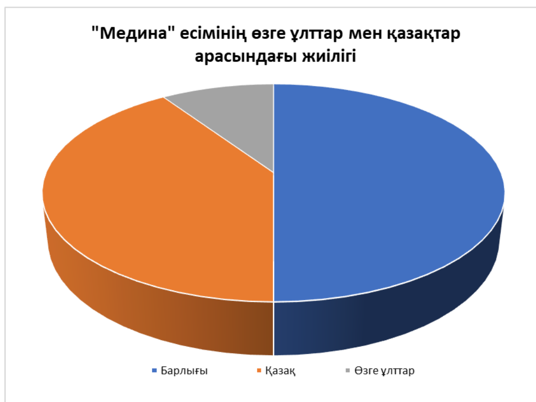
Сурет 2. «Медина» есімінің қойылуының ұлттық сипаты

Медина есімінің 1 жас пен 80 жас аралығындағы қойылу жиілігін анықтадық. Бұл кестеге салғанда былайша көрініс тауып отыр. Медина есімі соңғы 7 жылдықта ғана қойылу жиілігі артқан. Оған дейінгі бесжылдықта 1000 да жетпесе, оның алдындағы 5 жылдықта 500 ге