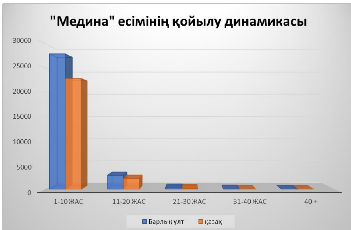
Сурет 1. «Медина» есімінің қойылу динамикасы