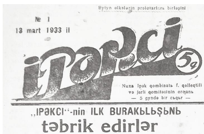
Рис. 3. – Газета «Шелковод»