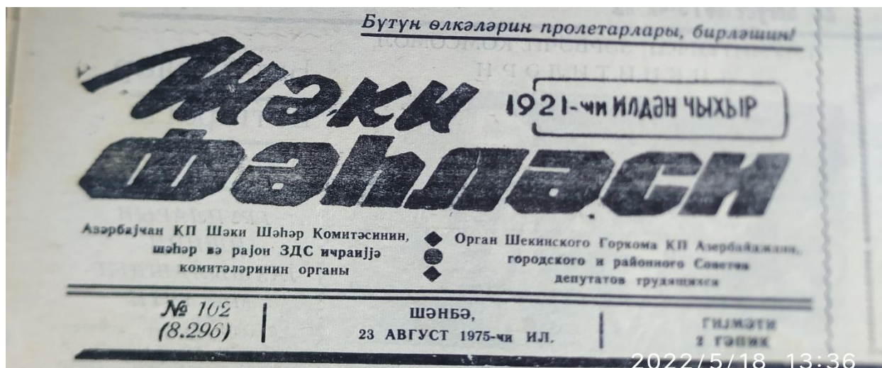
Рис. 2. – «Газета Шекинский рабочий»

В 1925 году в силу финансовых причин газета «Шекинский рабочий» («Şəki fəhləsi») вынуждена была закрыть свое издание (рис. 2).